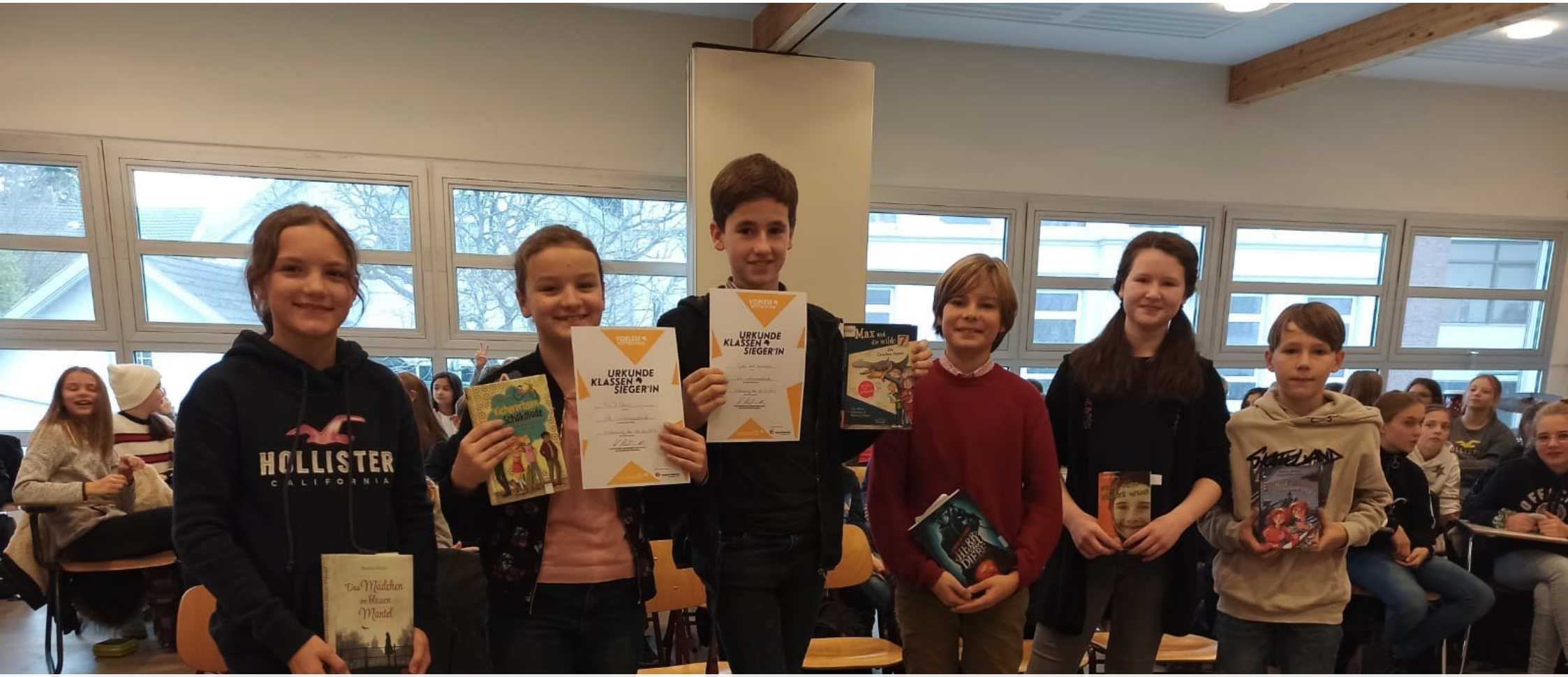
Vorlesewettbewerb der 6. Klassen