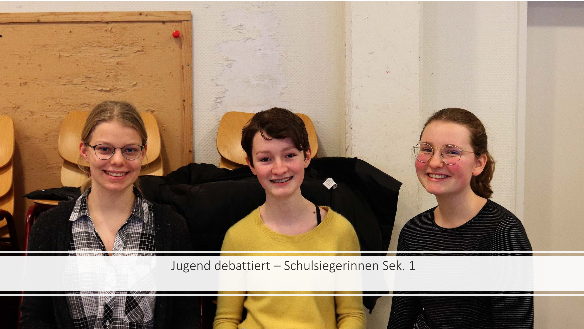
Jugend debattiert – Schulsiegerinnen Sek. 1