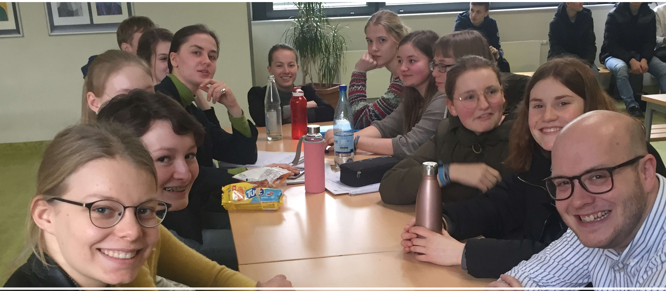
Jugend debattiert - Regionalwettbewerb