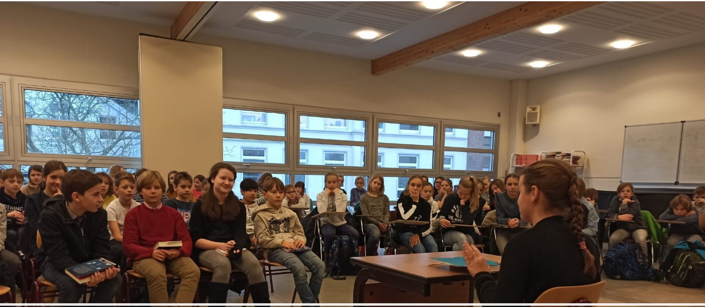
Vorlesewettbewerb der 6. Klassen