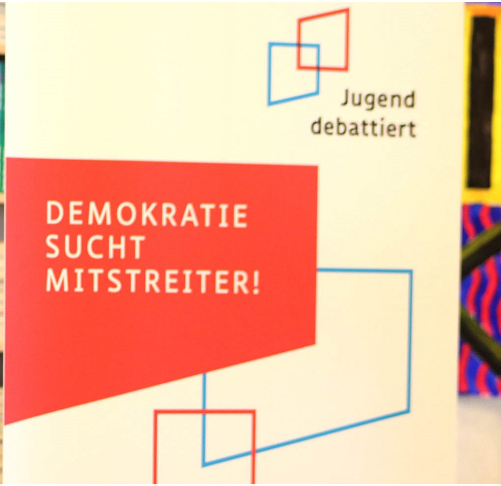
Jugend debattiert – Finale des Schulwettbewerbs