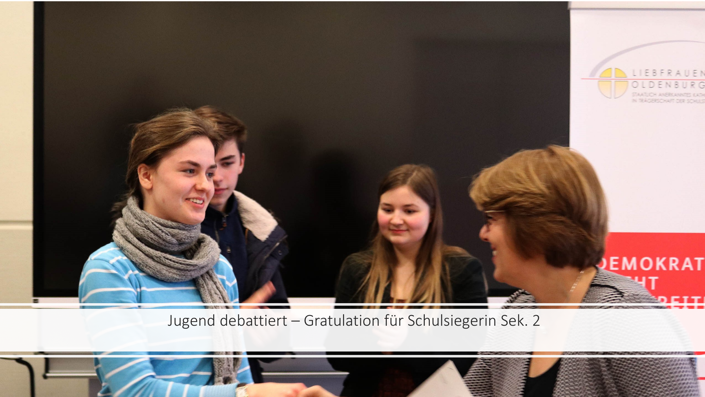
Jugend debattiert – Gratulation für Schulsiegerin Sek. 2